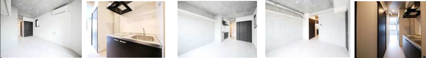
4号室 リビング 4号室 システムキッチン 4号室 リビング・CL 503号室 リビング 503号室キッチン・ホール