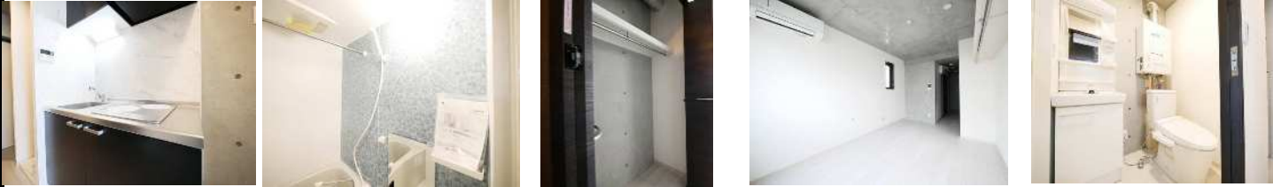
2号室 システムキッチン 2号室 ユニットバス 2号室 クローゼット 2号室 リビング 2号室パウダールーム