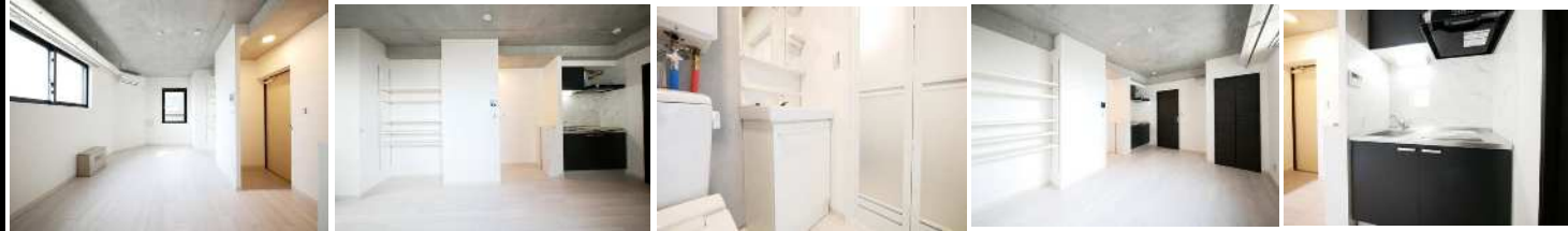
1号室 リビング 1号室 リビング・キッチン 1号室 パウダールーム 1号室 リビング・CL 1号室 システムキッチン

人気の東急2路線4駅利用可の好立地♪インターネット無料(^^♪ ♪新築デザインズ♪スーパー近く買い物便利♪敷金0円キャンペーン中です!